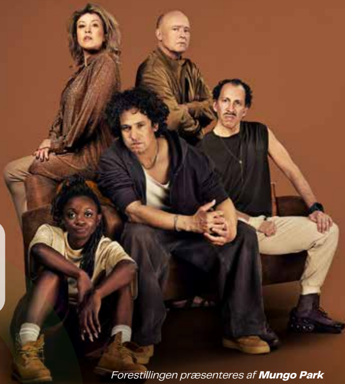
Forestillingen præsenteres af Mungo Park

Voksen 100 kr. Ung 40 kr. Sølv 60 kr. Guld 50 kr. + billetgebyr